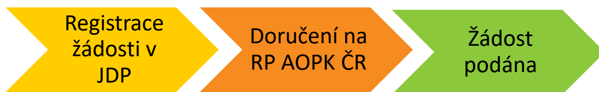
Obrázek č. 1: Kroky vedoucí k podání žádosti

Ekonomické přílohy ve formátu ZIP a rozpočet je nutné do JDP nahrát vždy. Ostatní přílohy, které není možné z kapacitních důvodů nahrát přímo do JDP, doručte na AOPK ČR stanoveným způsobem.