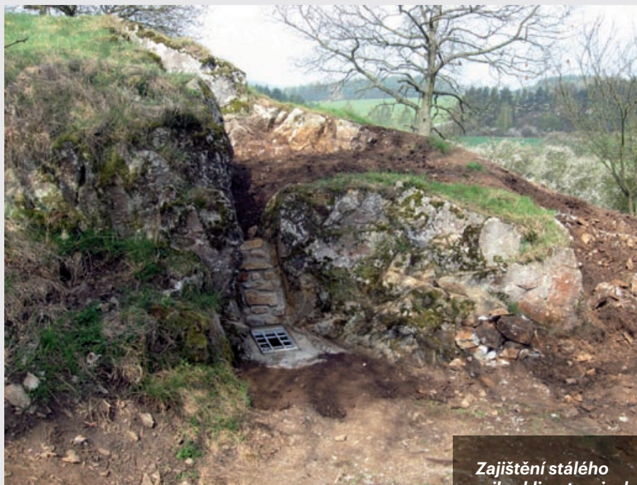
Zajištění stálého mikroklimatu v jeskyni

Jedná se o 12 metrů dlouhou puklinovou jeskyni vytvořenou v krystalických vápencích sedlčansko-krásnohorského metamorfovaného ostrova. Lámání kamene bohužel značně poškodilo původní morfologii jeskyně, která přišla o část svého stropu. Proto v zimním období docházelo k jejímu vymrzání. Pro zajištění stálého mikroklimatu v jeskyni byl zajištěn strop a vytvořen vstup s vletovým otvorem. Zajištění stropu a vstupu do jeskyně bude mít rozhodný účinek na stabilizaci mikroklimatu jeskynních prostor a je velice pravděpodobné, že tyto prostory se stanou zimovištěm pro menší druhy netopýrů, kteří jeskyni dosud využívají jako úkrytu během jarních a podzimních přeletů. Nedaleko této jeskyně (500 a 400 metrů) jsou další jeskyně, které jsou známé jako zimoviště menších druhů netopýrů (např. n. vodní, n. ušatý, vrápenec malý).