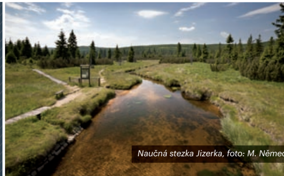
Naučná stezka Jizerka

Území České republiky se nachází ve středu Evropy, což ji samo o sobě vystavuje výraznému působení stále narůstajícího cestovního ruchu (dnes jedno z nejrychleji rostoucích ekonomických odvětví). ČR disponuje, při zohlednění velikosti svého území a geografické poloze uprostřed nejvíce pozměněného kontinentu, nadprůměrným přírodním, kulturním a krajinným potenciálem pro jeho rozvoj. Zároveň jsou však nejatraktivnější přírodní lokality ČR často velmi zranitelné právě i v rámci turistických aktivit.