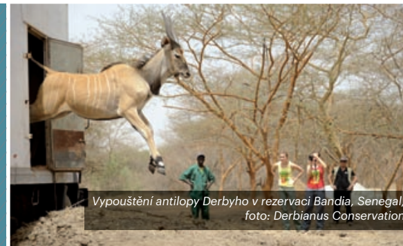
Vypouštění antilopy Derbyho v rezervaci Bandia, Senegal

Mezinárodní spolupráci v oblasti ochrany biodiverzity lze rozdělit na tři základní oblasti – globální, evropskou (celoevropskou a v rámci EU) a přeshraniční. Česká republika je smluvní stranou všech významných mnohostranných mezinárodních smluv o ochraně přírody a členem řady mezinárodních mezivládních organizací, jako jsou odborné instituce a programy OSN, Organizace OSN pro zemědělství a výživu, FAO, Program pro životní prostředí UNEP, Program pro rozvoj UNDP, Rada Evropy či Organizace pro hospodářskou spolupráci a rozvoj (OECD). V rámci EU je ČR vázána jak právem EU, tak strategií ochrany biodiverzity, se sousedními zeměmi pak ČR navázala intenzivní spolupráci, jejímž výsledkem je několik přeshraničních dohod v oblasti ochrany přírody a krajiny a péče o biologickou rozmanitost. Obecným cílem spolupráce na mezinárodní úrovni je naplňování závazků, které jsou v rámci mnohostranných mezinárodních smluv přijímány, konkrétním cílem je pak podpora zahraničních aktivit ČR, které přispívají k ochraně či zachování biodiverzity zejména v rozvojových státech. Hlavním smyslem přeshraniční spolupráce se sousedními zeměmi zůstává zajištění odpovídající návaznosti na opatření realizovaná v oblasti ochrany přírody v jednotlivých zemích na celostátní úrovni.