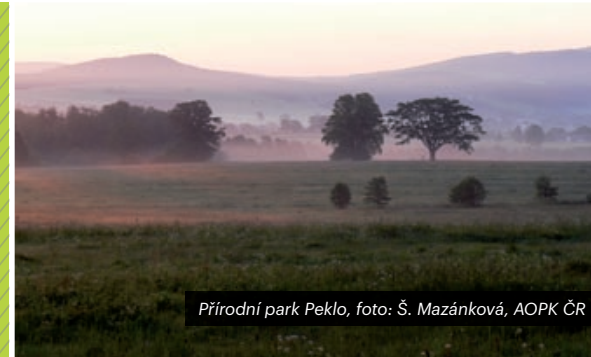
Přírodní park Peklo

Krajina je široce užívaným pojmem s mnoha významy. Obecně označuje část prostoru – území, které člověk vnímá, ve kterém se odehrávají různé procesy a děje a jehož současný stav je vyvolán minulými přírodními i lidskými aktivitami. I když je krajina definována jako vybraná část zemského povrchu s typickou kombinací přírodních a kulturních prvků a charakteristickým rázem, je vhodné ji vnímat spíše jako celostní integrující koncept na vyšší hierarchické úrovni s vlastní historií, dynamikou a charakteristickými rysy. Vztah člověka a krajiny je přitom příkladem přímé a zpětné vazby: člověk je její součástí a současně ji významně přetváří.