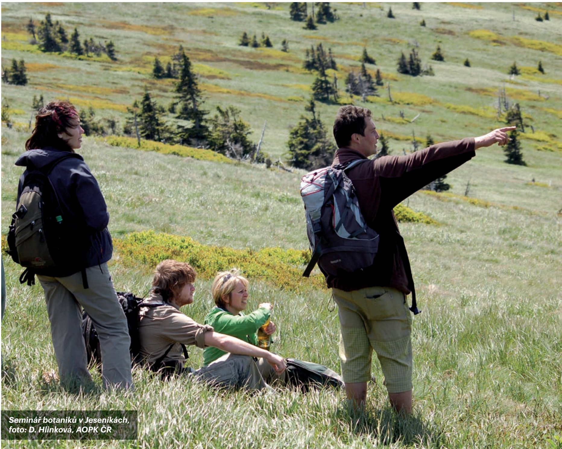
Seminář botaniků v Jeseníkách