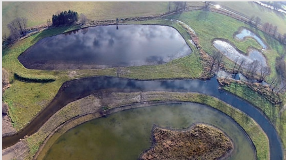
Kozmické louky u Opavy

Počátek projektu Kozmických luk se datuje do roku 2006. K vlastní realizaci došlo v roce 2014. Jedná se o vytvoření mokřadních společenstev v okrese Opava. Projekt společnosti NET4GAS byl spolufinancován ze SFŽP – Operačního programu Životní prostředí, prioritní osy 6, oblasti podpory 6.4. Optimalizace vodního režimu krajiny v částce 5,4 mil. Kč. Investor dodal z vlastních prostředků přes 4 mil. Kč zejména na výkup pozemků a projektové práce, výběrová řízení a zpracování žádosti. Akce byla provedena v rámci programu „Blíž přírodě“ (viz následující příklad) a její realizace nepřinesla investorovi žádný ekonomický zisk, naopak, každoroční údržba si žádá další desetitisíce ze soukromých prostředků.