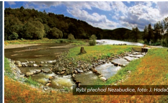
Rybí přechod Nezabudice, foto: J. Hodač

Smyslem ekonomických nástrojů v oblasti ochrany přírody a krajiny je akumulace a následná alokace a redistribuce finančních prostředků. Cílem je ovlivnit chování ekonomických subjektů a zabezpečit prostředky pomáhající chránit a zlepšovat stav biodiverzity v České republice. Ekonomické nástroje plní funkce kompenzační, fiskální, stimulační, redistribuční a komparativní. Kompenzační funkcí se rozumí např. vyrovnání vícenákladů nebo ztrát vyvolaných omezením činnosti nebo požadovanou činností (včetně kompenzace, kdy je nahrazován vlastníku či hospodáři ušlý zisk za odlišné opatření zohledňující požadavky OP). Fiskální funkce představuje příjmy státního rozpočtu (nebo SFŽP), které jsou použity na subvence a zabezpečování ochrany přírody a krajiny. Stimulační funkce podporuje chování ekonomických subjektů ve prospěch zájmů ochrany přírody a krajiny. Redistribuční funkce umožňuje usměrnění toků podle priorit politiky v oblasti ochrany přírody a krajiny. Komparativní funkce přispívá k vyrovnávání různých ekonomických podmínek ekonomických subjektů, např. hospodářů v ZCHÚ.