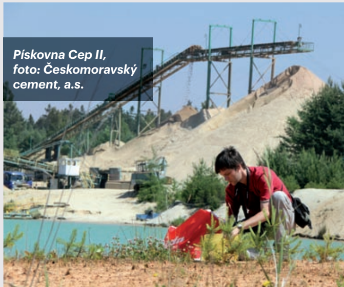
Pískovna Cep II