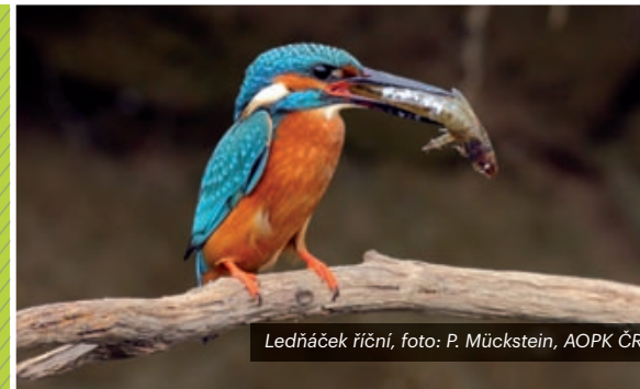
Ledňáček říční

Druhy organismů (živočichů, rostlin, hub, jednobuněčných organismů i virů) zůstávají základní jednotkou pro definici rozmanitosti přírody. Druhová ochrana je díky tomu vedle územní ochrany a ochrany přírodních procesů základním oborovým pilířem péče o přírodní a krajinné dědictví. Druhová ochrana navíc vykazuje relativně vyšší potenciál vhodně veřejnosti prezentovat nezbytnost ochrany biologické rozmanitosti.