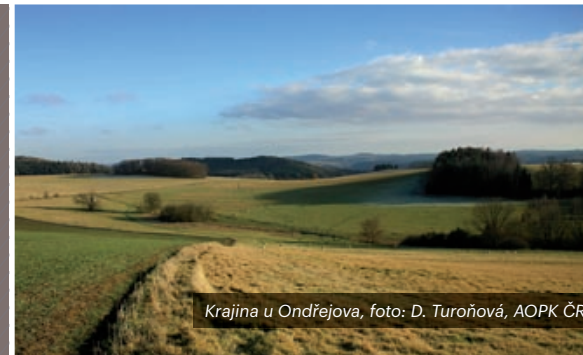
Krajina u Ondřejova

Pokračující zhoršování stavu biodiverzity v zemědělské krajině, ať už se jedná o početnost druhů, nebo stav stanovišť, ukazuje, že je nutné vynaložit významně vyšší úsilí, má-li být biologická rozmanitost zachována a posílena. V tomto procesu má zásadní úlohu zemědělská politika v ČR, která je rozhodující měrou určována společnou zemědělskou a společnou rybářskou politikou EU. Hlavním nástrojem společné zemědělské politiky EU v ČR zůstává Program rozvoje venkova, mezi jehož hlavní cíle patří obnova, zachování a zlepšení ekosystémů závislých na zemědělství zejména prostřednictvím agroenvironmentálně-klimatických opatření a podpory krajinné infrastruktury. V případě společné rybářské politiky EU pak Operační program Rybářství, který má mj. podporovat formy hospodaření přispívající k zachování či zlepšování stavu životního prostředí a biologické rozmanitosti.