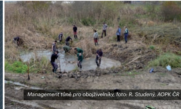
Management tůně pro oboživelníky, foto: R. Studený, AOPK ČR

Ústředním správním orgánem ochrany přírody a krajiny je Ministerstvo životního prostředí. Výkon státní správy v oblasti ochrany přírody a krajiny je zajišťován státními úřady a v přenesené působnosti obecními úřady všech stupňů a krajskými úřady. Právě krajské úřady a obce s rozšířenou působností (obce III. kategorie) mají významný vliv na zajištění ochrany biodiverzity na většině území ČR. Významné postavení z hlediska ochrany biodiverzity má tzv. „speciální státní správa“ (především AOPK ČR a správy NP) zajišťující ochranu a péči o lokality národního významu. Ve vojenských újezdech je státní správa zajišťována Ministerstvem obrany a újezdními úřady. Stav a využívání biodiverzity zásadně ovlivňuje také výkon státní správy ostatních ústředních orgánů (zejména MMR, MZe, MZd, MK, MPO, MO, MD) a státních úřadů