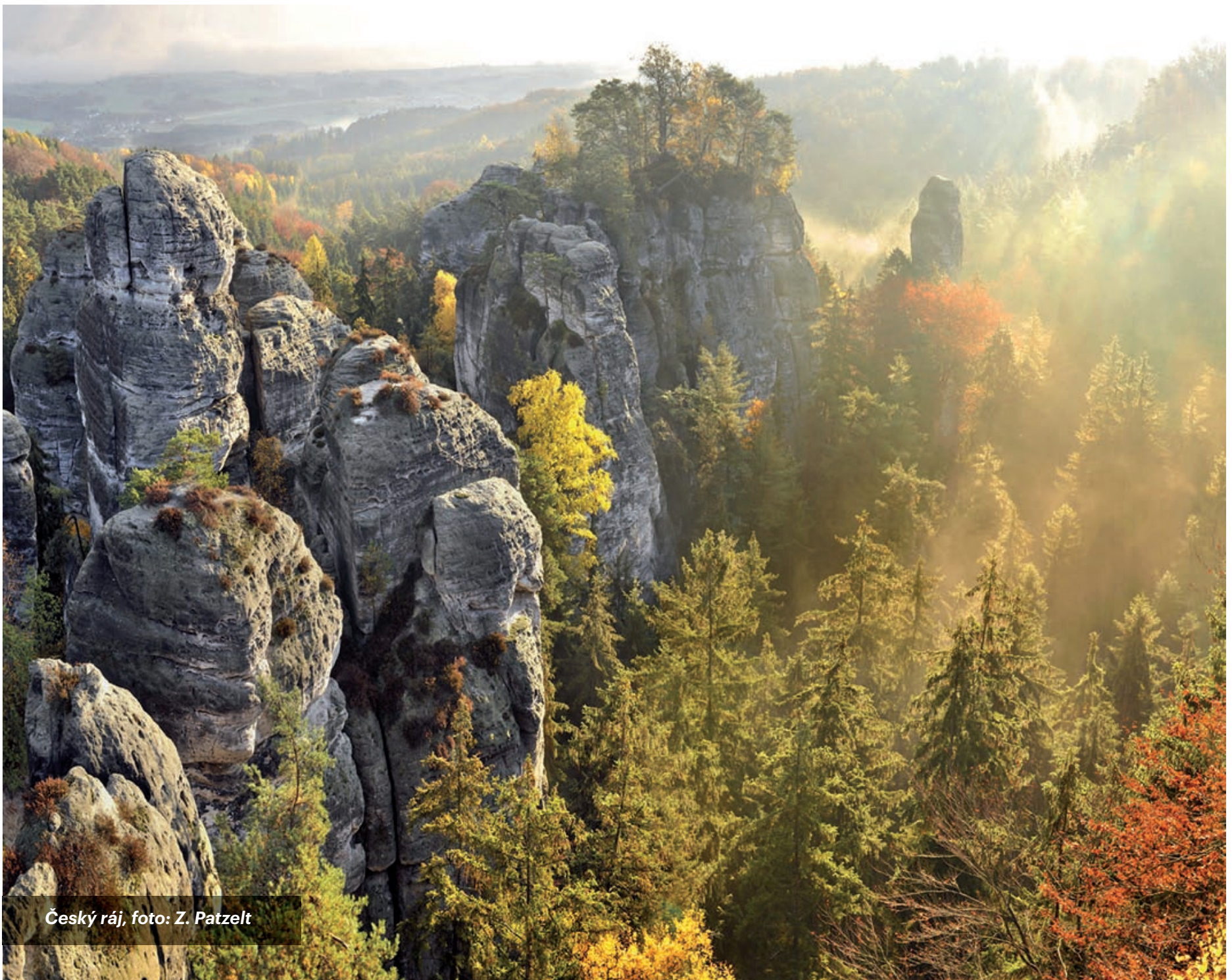
Český ráj