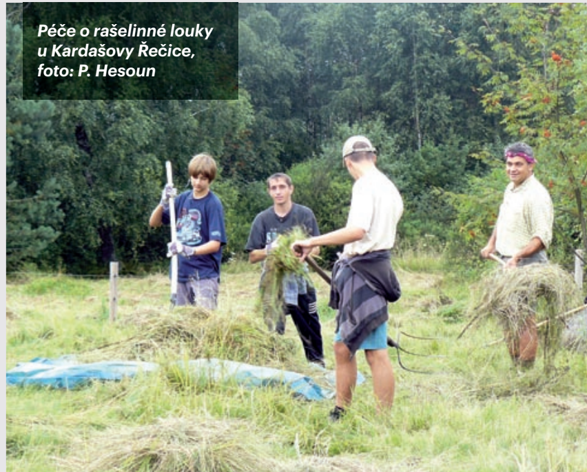
Péče o rašelinné louky u Kardašovy Řečice, foto: P. Hesoun

Obce s rozšířenou působností v Jihočeském kraji (zejména MěÚ J. Hradec a MěÚ Dačice) aktivně využívají vrstvu mapování biotopů AOPK ČR, vlastních znalostí terénu, případně konzultací se specialisty botaniky a fytoecology. V souladu s tím spolupracují s dalšími obcemi, vlastníky a neziskovými organizacemi a iniciují péči o nejvýznamnější lokality s využitím podpory z Programu péče o krajinu MŽP. Informují o významných lokalitách uvedené subjekty, seznamují je s možnostmi získat příspěvek z Programu péče o krajinu, často jim pomáhají i s přípravou žádostí, komunikací mezi vlastníky a neziskovými organizacemi atd. Tímto způsobem se doposud podařilo zajistit za přispění financí z Programu péče o krajinu údržbu několika desítek hektarů nejvýznamnějších biotopů zejména podmáčených a rašelinných luk.