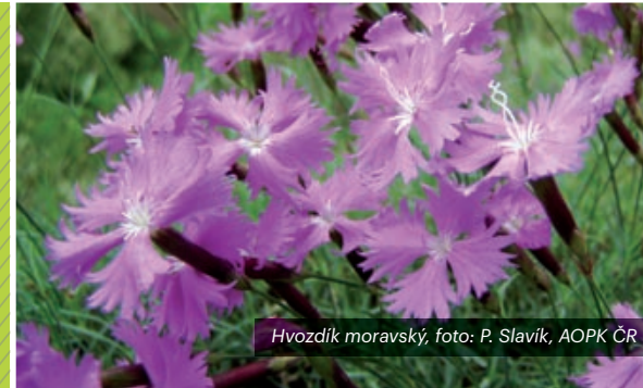
Hvozdk moravský

Genetická rozmanitost zůstává nejméně známým aspektem biologické rozmanitosti. Proto byla a dosud je i přes překotný rozvoj jejích poznatků ochraně genetické diversity věnována relativně menší pozornost. Nové informace jasně ukazují na zásadní význam genetické diversity pro přežívání životaschopných populací mnoha organismů. Kromě vlastního významu pro přírodní stabilitu má právě genetická složka biodiverzity velký význam pro člověka a jeho hospodářskou činnost, protože představuje přirozenou zásobárnu rozmanitých genotypů pro případné využití ve šlechtitelství a následně v zemědělské výrobě, v biotechnologiích a v potravinářském, kosmetickém a farmaceutickém průmyslu.