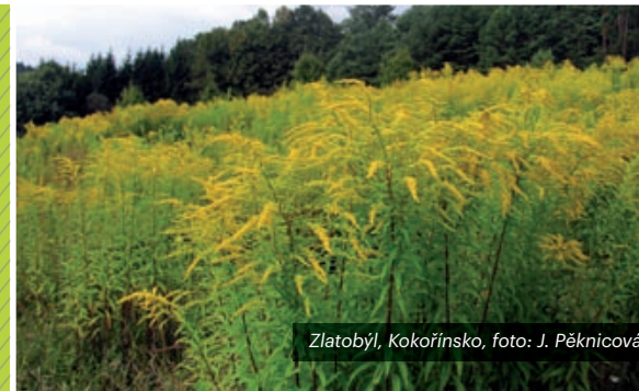
Zlatobýl, Kokořínsko, foto: J. Pěkníková

Invazní nepůvodní organismy představují vážnou hrozbu pro původní druhy, společenstva a ekosystémy na celém světě. V žebříčku hlavních činitelů (hnacích sil) ohrožujících stávající biodiverzitu zauímají globálně druhé místo. Nezanedbatelné jsou též ekonomické škody způsobené těmito druhy, některé invazní nepůvodní druhy (Invasive Alien Species – IAS) mohou zároveň působit negativně na lidské zdraví. V důsledku neustále vzrůstající mobility je rozšiřování IAS snazší a rychlejší, a to jak jejich rozšiřování záměrné, tak neúmyslné. Česká republika je v důsledku polohy, hustého osídlení a husté sítě řek, silnic a železnic jako hlavních cest šíření těchto druhů velmi náchylná k biologickým invazím.