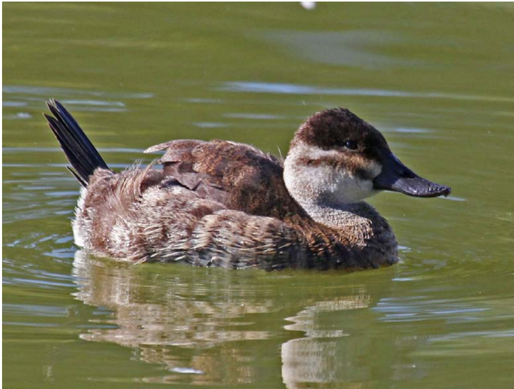
Obr. 4 Samice.

Riziko: Ve Španělsku se kříží s místní a celosvětově ohroženou kachnicí bělohlavou, což pro tento druh představuje vážný existenční problém.