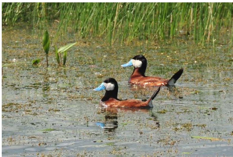
Obr. 1 Kachnice kaštanová.

Původ: Severní a střední Amerika. Hnízdí na rybnících a bažinatých jezerech amerického středozápadu, zimuje na pobřeží Severní Ameriky. Středoamerické populace bývají stálé.