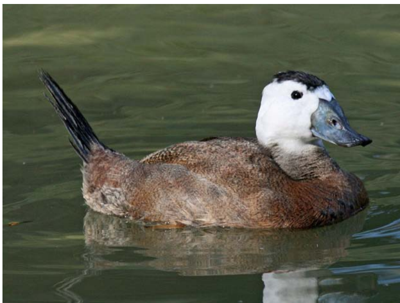
Obr. 5 Samec kachnice bělohlavé.

Kachnice bělohlavá ( Oxyura leucocephala ) je větší, má delší ocas a prakticky celou bílou hlavu, s výjimkou černého pruhu na temeni.